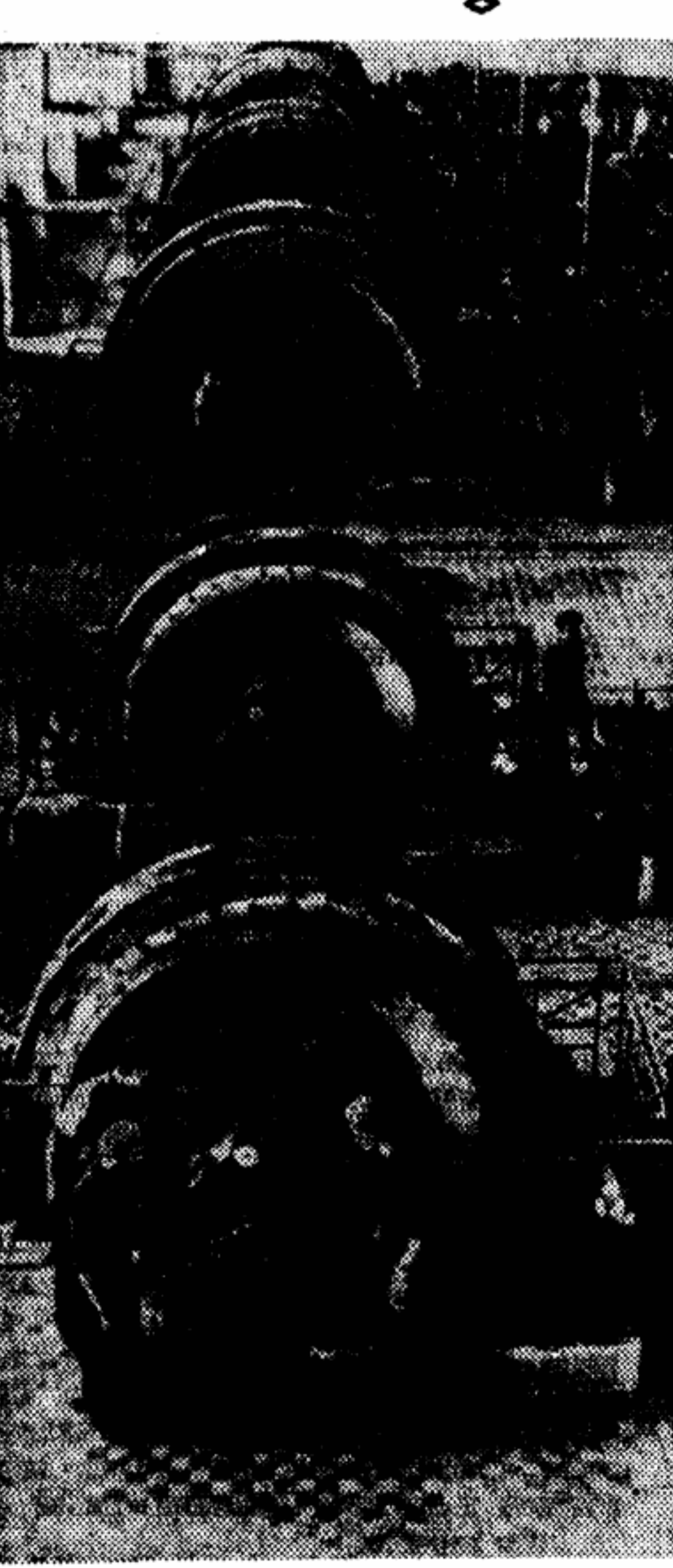
Большое внимание в ближайшем семилетии будет уделено химической промышленности. На снимке: машинный зал поршневого компрессора Грозинского химического завода.